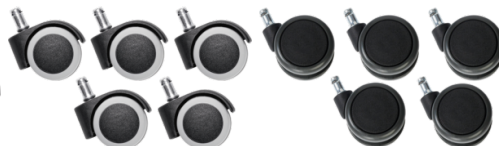
Réf. 7275006 Jeu de 5 roulettes sol dur