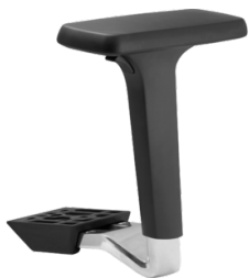
Réf. 7275008 Paire d'accoudoirs réglables 4D