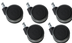
Réf. 7275001 Jeu de 5 roulettes grand diamètre